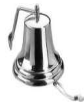
12. Campana de bronce