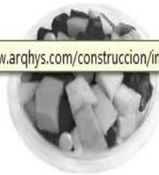
10. Coctel de frutas